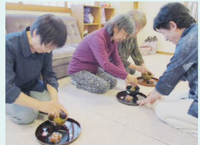
お抹茶を楽しむ会