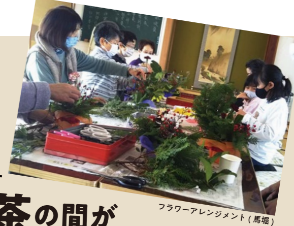
フラワーアレンジメント(馬堀)

コロナ禍の閉塞感を打ち破るように、地域の茶の間があちらこちらに誕生しています。地域の方々の趣味や特技などを持ち寄る事で、茶の間という居場所が豊かになったり、チャレンジする場にもなっています。今回は巻圏域に新しくできた茶の間を紹介합니다。