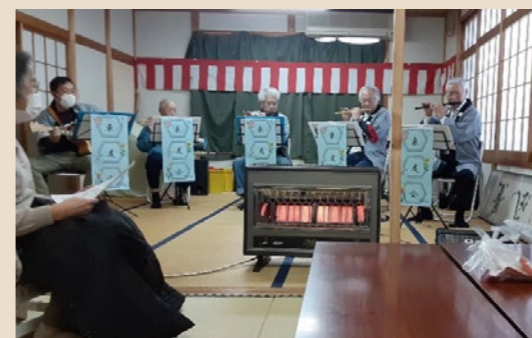
東友会の演奏風景

馬堀方面には馬堀中組に地域の茶の間ができました。自宅に咲いている花を持ち寄り、フラワーアレンジメントに挑戦しました。蒲原ガスさんから地域貢献活動で使用している花きり鉢を貸してもらったそうです。