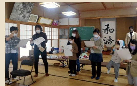
みんなでハンドベルに挑戦