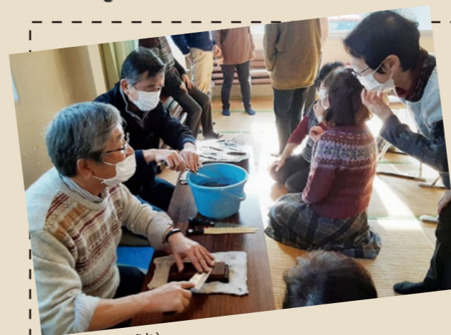
包丁研ぎの様子(漆山)